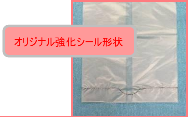
オリジナル強化シール形状