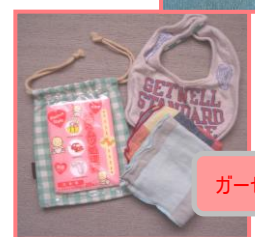
ガーゼ等の持ち帰りに